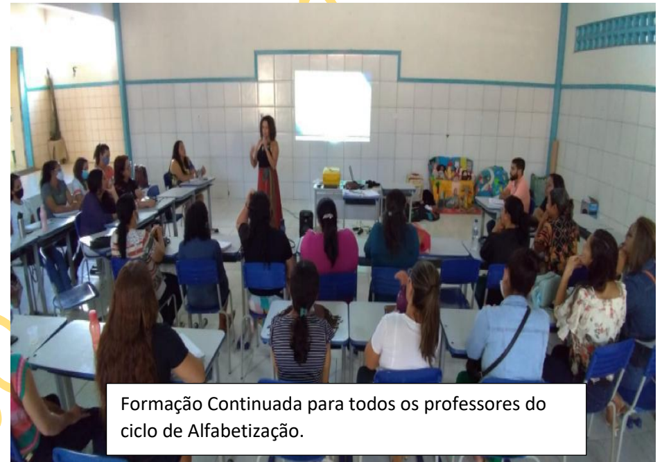
Formação Continuada para todos os professores do ciclo de Alfabetização.